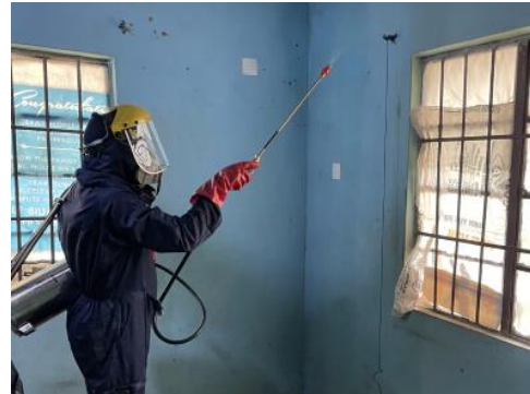
図 2. 専門オペレーターによる IRS 散布

マラリアは未だ84か国で流行しており、世界人口の半数はマラリアに感染する恐れのある地域で暮らしています。WHOの2021年の統計から年間2億人以上が罹患し死亡者の数は60万人以上にのぼると報告されています。この深刻な被害の大部分はサハラ以南アフリカ（サブサハラアフリカ諸国）の5歳未満の小児と妊婦に集中しています。