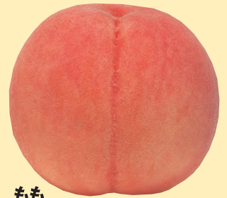
もも 灰星病、黒星病、 ホモブシス腐敗病に有効。