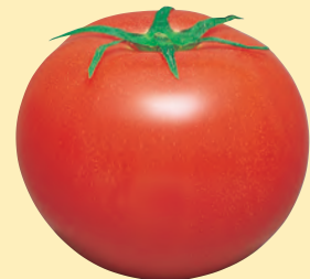
トマト・ミニトマト 灰色かび病、葉かび病に有効。