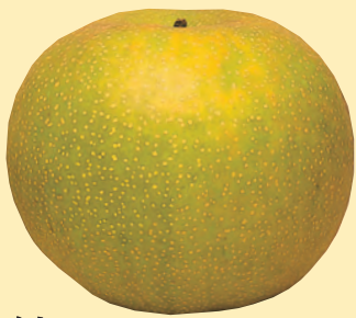
なし 黒斑病、黒星病、輪紋病、 うどんこ病に有効。