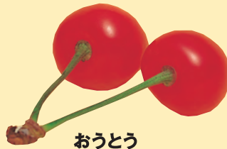
おうとう 灰星病に有効。