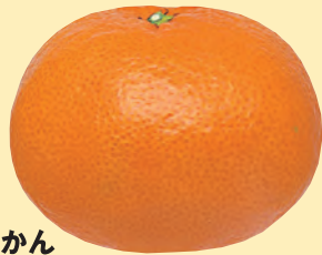
みかん 灰色かび病、貯蔵病害(青かび病、 緑かび病、黒腐病、軸腐病)に有効。 かんきつ 幹腐病に有効。