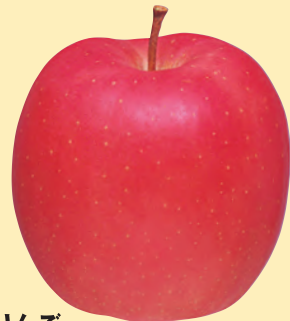
りんご 斑点落葉病、黒星病、褐斑病、 すす点病、すす枯病、輪紋病、 黒点病に有効。