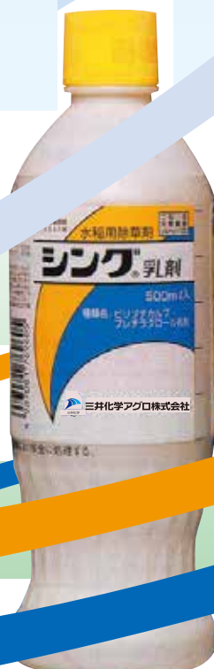
イメージ写真(実物と異なる場合があります)