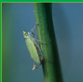
ツマグロヨコバイ