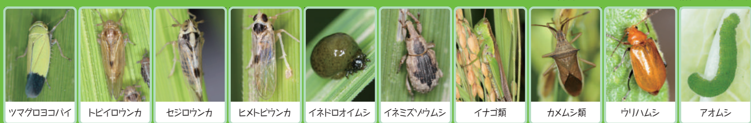
ツマグロヨコバイ トビイロウンカ セジロウンカ ヒメトビウンカ イネドロオイムシ イネミズゾウムシ イナゴ類 カメムシ類 ウリハムシ アオムシ